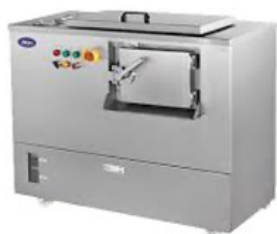
Composting food waste in 24 hours with heat and micro organisms